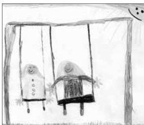
gemalt von Malin 2008

Damit sich auch in den nächsten Jahren die Kinder unter einem sicheren Dach in freundlichen Räumen treffen und drinnen wie draußen fröhlich spielen und lernen können, dazu bitten wir Sie um Ihre Spende.