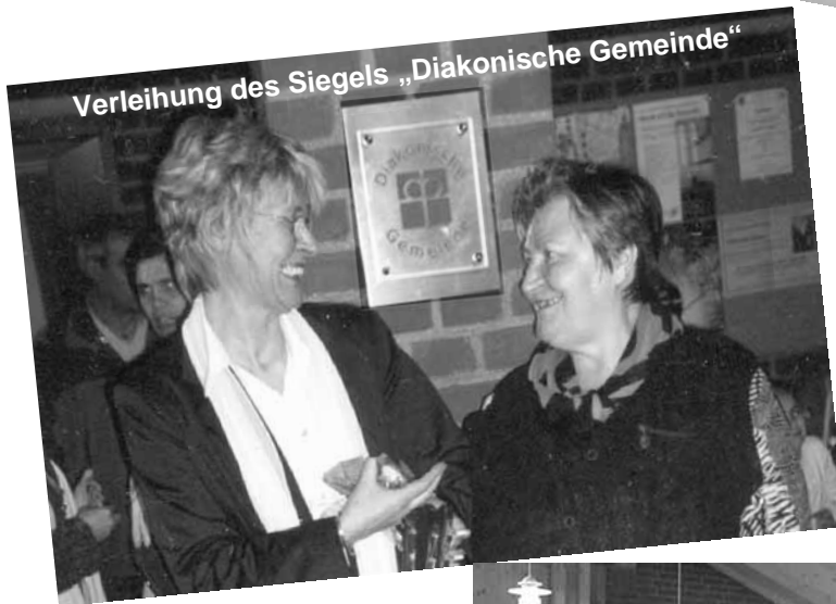
Verleihung des Siegels „Diakonische Gemeinde“