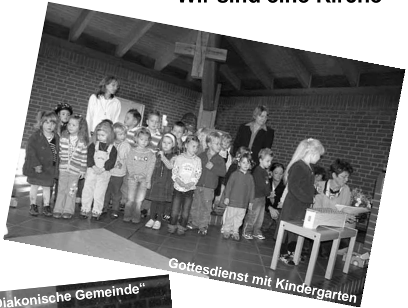
Gottesdienst mit Kindergarten