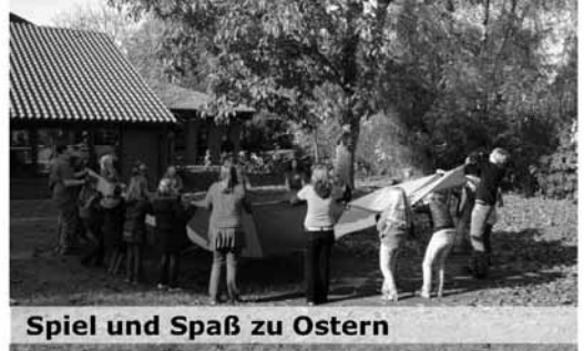
Spiel und Spaß zu Ostern